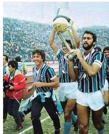
Em 1983 o Grêmio se sagrou campeão, mas a Fifa não mais reconhece