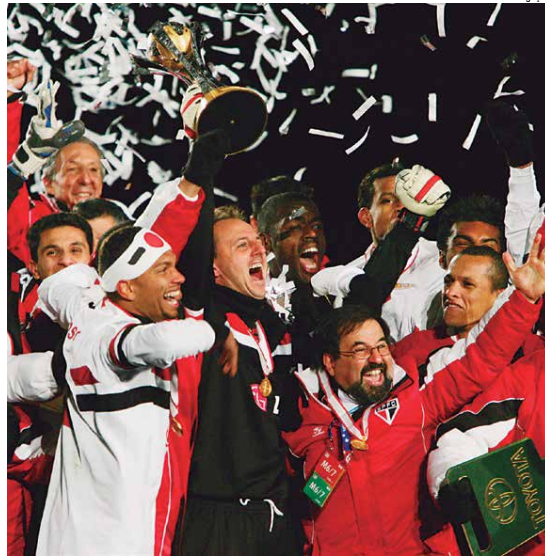
Osão Paulo, que já campeão mundial de clubes no ano de 2005, perde os títulos conquistados em 1991 e 1992