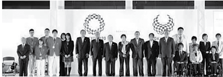
O Comitê Organizador dos Jogos Olímpicos de 2020, no Japão, vem convidando a população para se unir, visando uma boa competição no país

O Comitê Organizador visa coletar pelo menos oito toneladas de metal - 40kg de ouro, 4.920kg de prata e 2.944kg de bronze. Após o processo de produ-