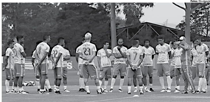
Equipe do Palmeiras começa hoje sua caminhada a mais um título estadual, com uma equipe que ainda está em formação, com novos jogadores

Os ingressos para a primeira rodada do Paulistão contra o São Paulo já estão à venda no site bilheteriaidigital.com.br. Para o torcedor do time osasquense, o Setor Audax está disponível pelo valor de R$ 100 (inteira) e R$ 50 (meia). Para a torcida do São Paulo, os setores A, A-1, B, C e C-1 estão à venda com preços que variam entre R$ 100, R$ 120 e R$ 140 com meia entrada em R$ 50, R$ 60 e R$ 80.