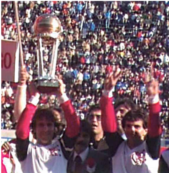
Título do Flamengo conquistado em 1981 diante do Liverpool, da Inglaterra, não é mais reconhecido