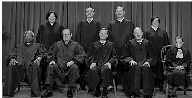
A Suprema Corte dos Estados Unidos está dividida atualmente entre quatro magistrados liberais e quatro conservadores

Segundo análise feita por Rajini Vaidyanathan, da BBC News, um dos momentos decisivos da campanha eleitoral nos EUA foi a morte do juiz da Suprema Corte, Antonin Scalia. "Enquanto eu viajava por toda a América, os Republicanos que não gostavam do estilo impetuoso de Trump, ou da forma como se referia às mulheres, me