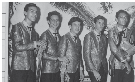
Conjuntos como os Quatro Loucos (foto acima), The Gentleman (foto à esquerda) e os Selenitas tinham um público cativo e versáteis repertórios musicais