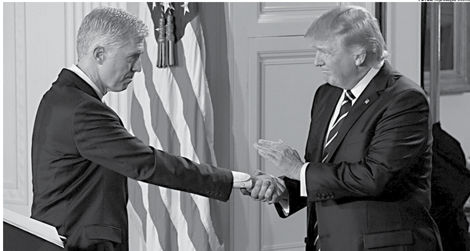
Presidente Donald Trump cumprimenta o juiz Neil Gorsuch, de 49 anos, de perfil conservador, quando da indicação para ocupar uma cadeira na Suprema Corte norte-americana

Ocasionalmente, a Suprema Corte revê questões e muda sua própria decisão, algo que movimentos antiaborto, por exemplo, esperam que aconteça mesmo com uma Corte de perfil conservador.