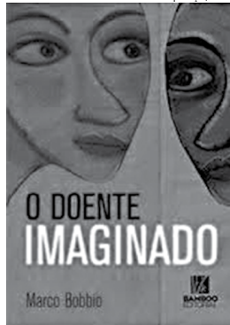
Capa do livro O Doente Imaginado